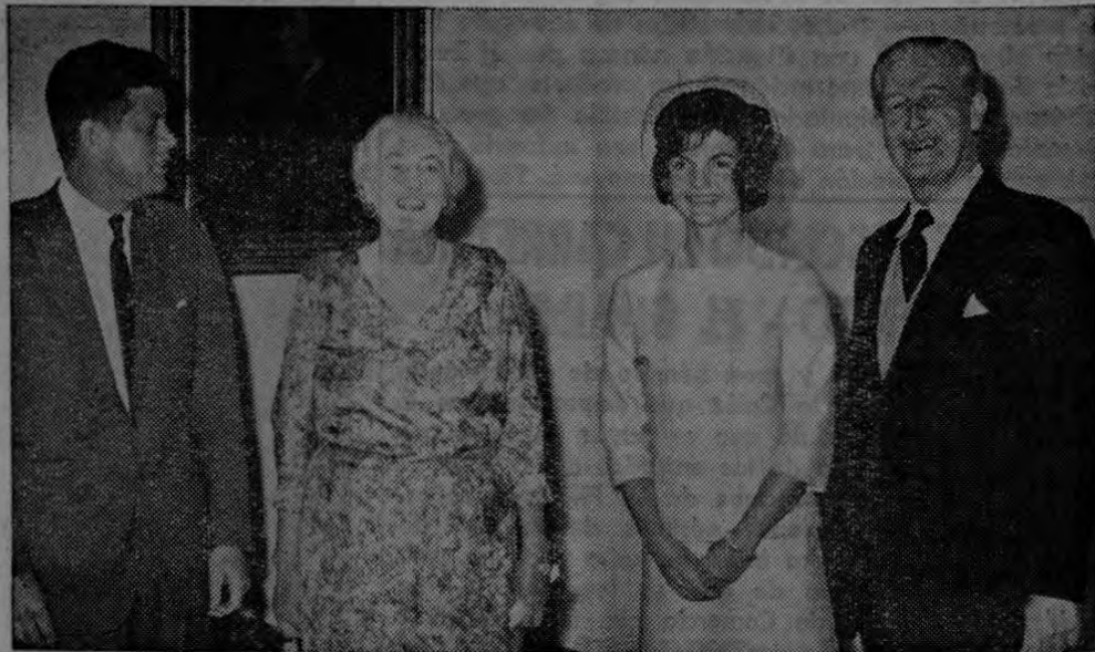
Mr. Harold Macmillan, Primer Ministro de la Gran Bretaña y su señora Dorotea, fotografiada al lado del Presidente Kennedy de los Estados Unidos y su esposa, cuando ellos entretuvieron al Presidente Americano y la Sra de Kennedy en el almuerzo en el Almirantazgo, Londres, Inglaterra, recientemente